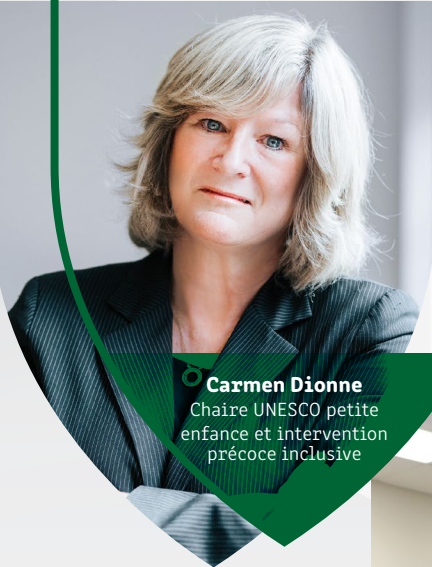
Carmen Dionne Chaire UNESCO petite enfance et intervention précoce inclusive