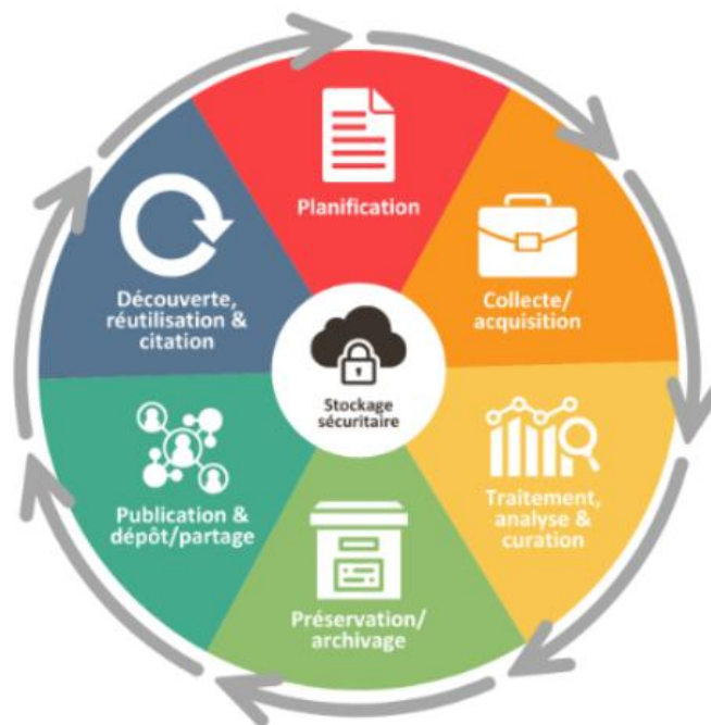
Le cycle de vie des données de recherche

La recherche à l'ère numérique soulève des enjeux cruciaux. Comment assurer un stockage sécurisé et accessible, tout en préservant la souveraineté des données dans un contexte de dépendance technologique croissante ? Quels choix faire entre les solutions propriétaires et "open source", et comment garantir leur pérennité et leur compatibilité avec les besoins de la communauté scientifique ? Par ailleurs, la formation aux outils numériques devient essentielle pour permettre à la communauté de la recherche de naviguer dans cet environnement en constante évolution. À cela s'ajoutent des préoccupations liées à la gestion des données sensibles, à l'éthique, et à l'intégration de l'intelligence artificielle dans les pratiques de recherche.