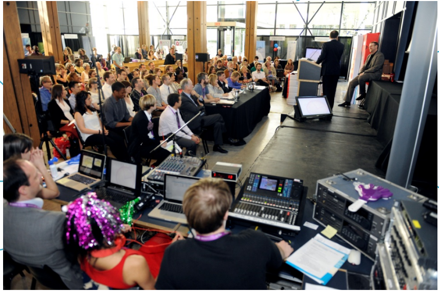
Table des membres du jury

Écran permettant au candidat de voir le chronomètre