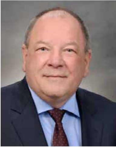
M' Brian Bigger

Le maire de la Ville du Grand Sudbury Mayor, City of Greater Sudbury